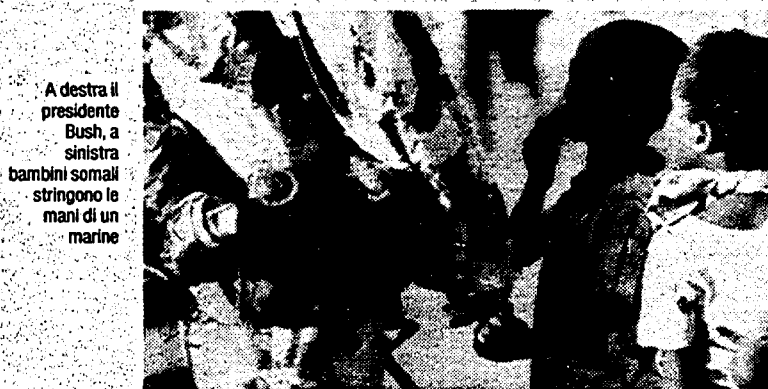
A destra il presidente Bush, a sinistra bambini somali stringono le mani di un marine

Howo presidenziali e la scorta volante dei Cobra da combattimento. Pochi minuti dopo Bush era all'ambasciata Usa. Lo attendeva una folla di soldati festanti.