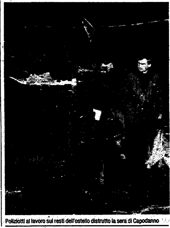
Poliziotti al lavoro sui resti dell'ostello distrutto la sera di Capodanno

Due morti e cinque feriti in due incendi divampati ieri in Germania, in edifici che ospitavano stranieri. Il ministero dell'interno tende ad escludere l'ipotesi dell'attentato.