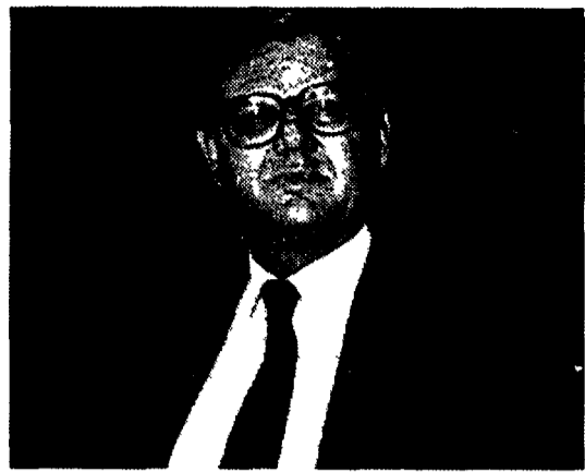
Il ministro del Tesoro Pierluigi Barucci