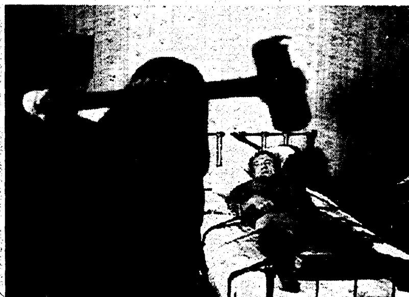
Un momento di «Misery non deve morire» che manderà in onda Canale 5

Il prossimo film (Tra la vita e la morte) ha per protagonista un povero marito che deve scegliere se salvare la vita della