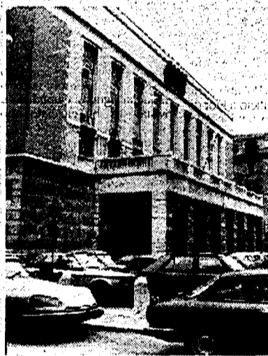
Il Teatro dell'Opera da ieri commissariato dal ministro del Turismo

sta di «Quarto potere» saranno in scena dal 23 aprile al 24 maggio. La rassegna sarà collegata con lo spettacolo teatrale di Giorgio Barberio Corsetti tratto dalla trasmissione radiofonica «La guerra dei mondi», dal romanzo «Mr Arkadin» e da sceneggiature di film di Welles. Il padre del grande Western sarà ricordato in dicembre, in contemporanea con la mostra sulla pittura della frontiera americana. Grazie alla collaborazione con il Centro culturale francese e con la Videotèque di Parigi, una produzione romana sarà esportata nella capitale francese. Si tratta della rassegna «Ritratto di Roma», 42 filmati che propongono diverse atmosfere della città. Questa iniziativa è in cartellone in contemporanea con la mostra «Tutte le strade portano a Roma?».