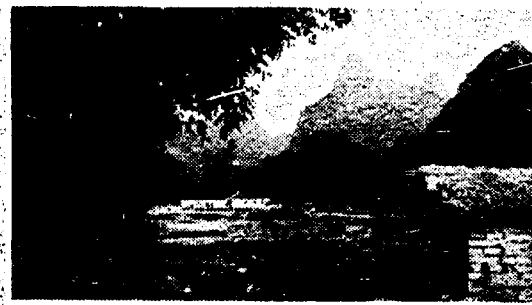
Gulin. Villaggio rurale

L'esperienza diversa di una Cina al di fuori degli itinerari tradizionali. Nel Sud tropicale dove più spinta è la liberalizzazione economica, più vistoso il boom e i contrasti sociali. L'iniziativa di Unità Vacanze con i lettori del giornale combina la visita ai luoghi storici più affascinanti e celebri con la scoperta di realtà ancora sconosciute agli occidentali.