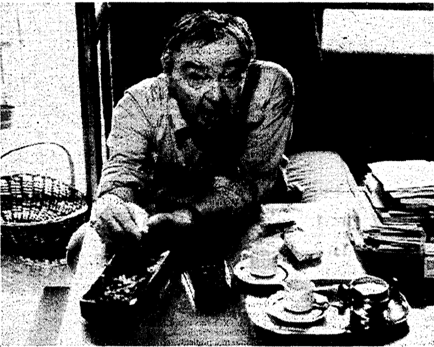
Romano Bilenchi nel suo studio: le sue «Opere» stanno per essere pubblicate da Rizzoli