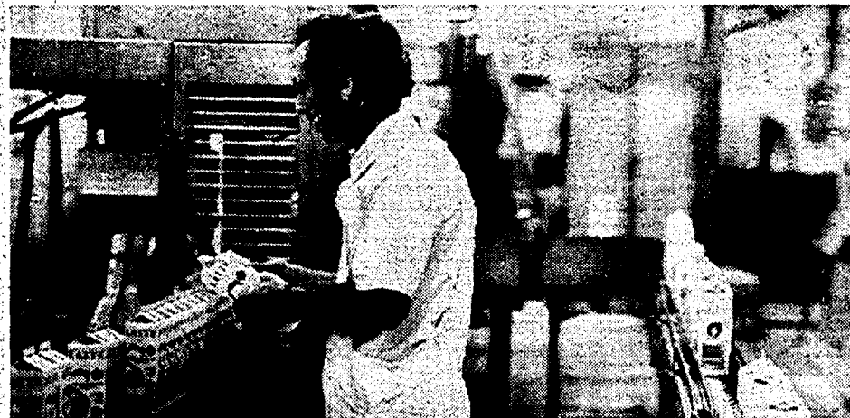
La fase d'imbustatura del latte. La polemica sulla qualità si è sgomitata