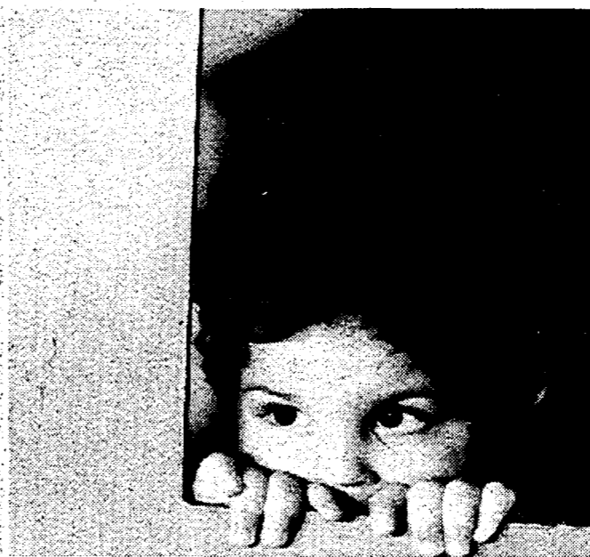
«Voglia di tenerezza» si occupa di adozioni difficili

ROMA. Su Raitre alle 23.40. La nuova proposta della rete che prende il via domani, «Voglia di tenerezza», un lungo viaggio nel difficile mondo delle adozioni, ha molti tratti in comune con i filmati di «Storie vere».