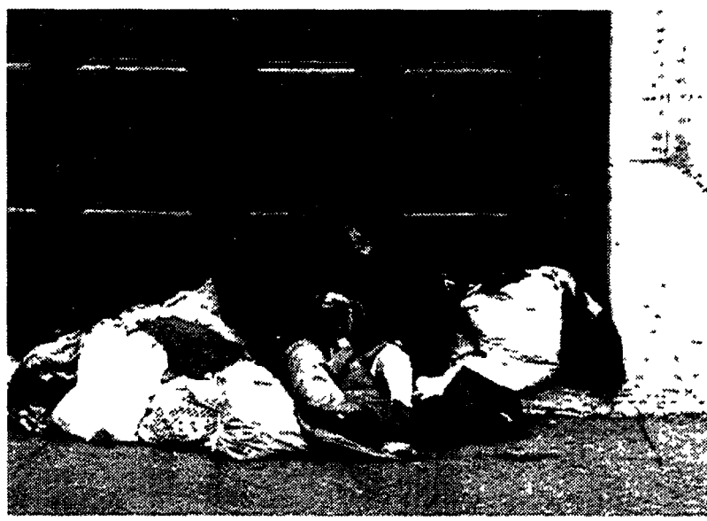
Povertà e volontariato. Ne parla «Insieme» su Raitre

Da poco più di due anni Insieme, programma settimanale di Raitre che va in onda il sabato alle 19.50, si occupa dell'associazionismo e del volontariato.