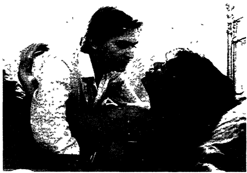
«Il diavolo in corpo» di Marco Bellocchio, uno dei film di «Clak si legge»

serie - come le altre iniziative - nasce da una forte esigenza di gruppo, serve a far da grancassa all'ultima invenzione del cavalier Berlusconi, che per rilanciare il settore (non dimentichiamo che è proprietario della Mondadori) si è inventato la settimana del libro e addirittura il «book day», domenica 7 marzo, festività che va ad aggiungersi ai vari «San Valentino», «giorno della mamma», «giorno del papà» e quant'altri. Una notte dopo l'altra vedremo così Manhunter-Frammenti di un omicidio dal best-seller di Thomas Harris («l'autore del Silenzio degli innocenti») e diretto da Michael Mann. L'insostenibile leggerezza del cedere di Milan Kundera portato al cinema dal regista Philip Kaufman, Il giorno della civetta di Leonardo Sciascia, diretto nel '68 da Damiano Damiani con Claudia Cardinale e Franco Nero, Il pianeta delle scimmie dal romanzo di Pierre Boulle, che diede vita a una fortunata serie di cui l'Italia 1 propone il primo film, con Charlton Heston, Il diavolo in