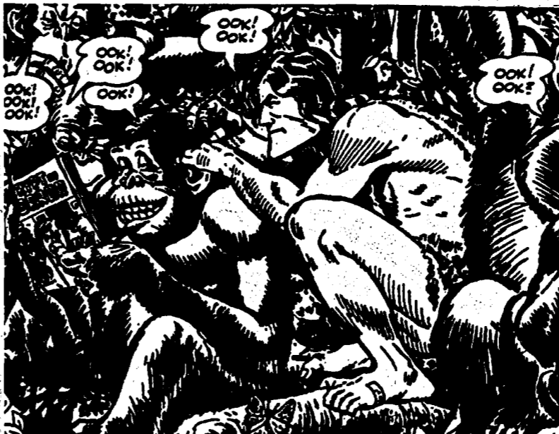
Tarzan in versione fumetto