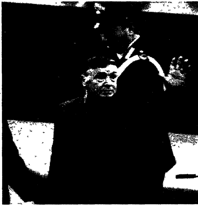
Totò Riina al termine del suo «show» nell'aula bunker