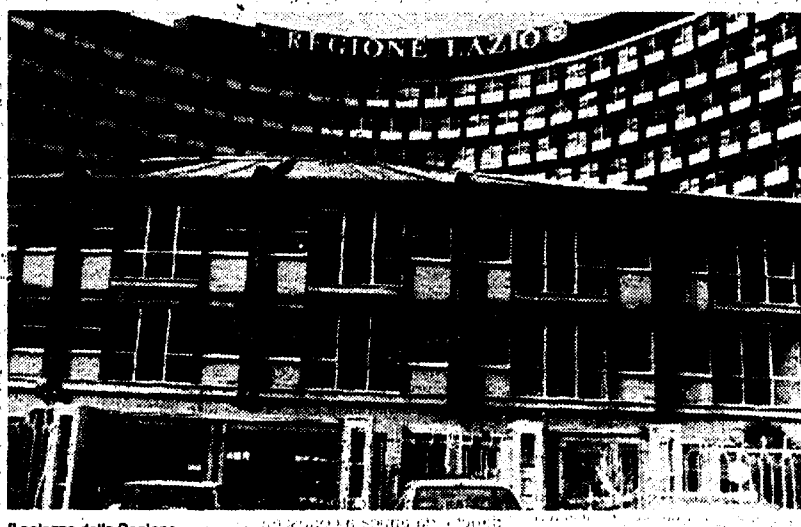
Il palazzo della Regione