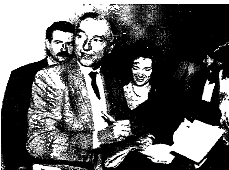
Piero Angela. Presto un'«Enciclopedia» dei numeri di «Quark»

È in arrivo su Raiuno, a partire dal 16 aprile, una nuova rubrica scientifica. L'«Enciclopedia di Quark», a cura di Piero Angela, sarà composta di numeri monografici su antropologia, psicologia, fisica, biologia e genetica.