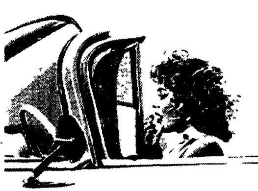
Una scena del film «Hot spot»

■ ROMA Tempi duri per il cinema in tv. Stavolta, infatti, non si tratta delle solite lamentele per le interruzioni pubblicitarie, ma piuttosto di «frammentazioni» grossolane nella messa in onda dei film, per rispetto delle ferree leggi del palinsesto. Questo infatti è quanto accaduto giovedì sera su Italia 1, la rete Fininvest che con grandi clamori (per altro) aveva annunciato la messa in onda, in prima visione, di Hot Spot (il posto caldo) di Dennis Hopper. Il film in programma alle 22.30 è stato bruscamente interrotto, proprio a pochi minuti dal finale, intorno a mezzanotte e mezza, per mandare in onda l'edizione notturna del