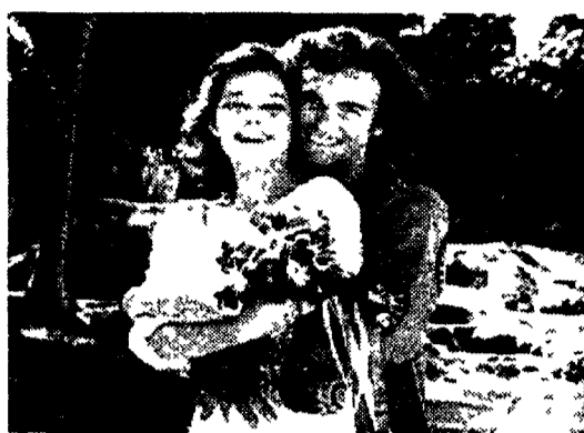
Due dei protagonisti di «Sentieri»

Nel sistema ternario sul quale il sistema tv sembra essersi disegnato con scaramantica e dantesca grandiosità, si celava però il vizio di origine che avrebbe in seguito creato le attuali difficoltà alla tv a pagamento. L'inghippo stava nel fatto che, dentro la trade pay-tv, c'era fin dall'inizio lo zampino di Berlusconi. Insomma.