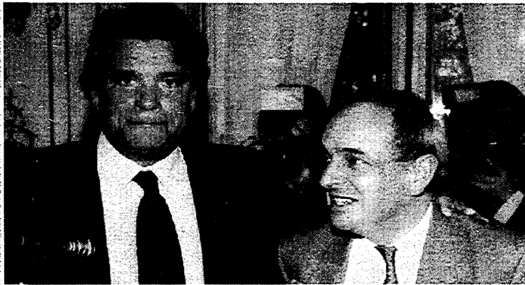
Bernard Tapie, il manager amico di Mitterrand, candidato socialista per Marsiglia

MARSIGLIA: Si balla il rap nei quartieri nord, quelli delle cités che scoppiano di magrebini e africani. Si balla tra mare e cemento e circonvallazione aspettando che venga la bella stagione e che si vada tutti in spiaggia.