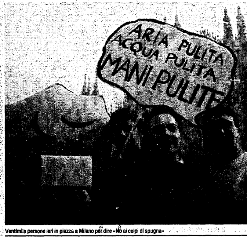
Ventimila persone ieri in piazza a Milano per dire «No ai colpi di spugna»

«Non riprovaletci!». Per la seconda volta in pochi giorni, ieri Milano è scesa in piazza contro i colpi di spugna che vogliono cancellare Tangentopoli.