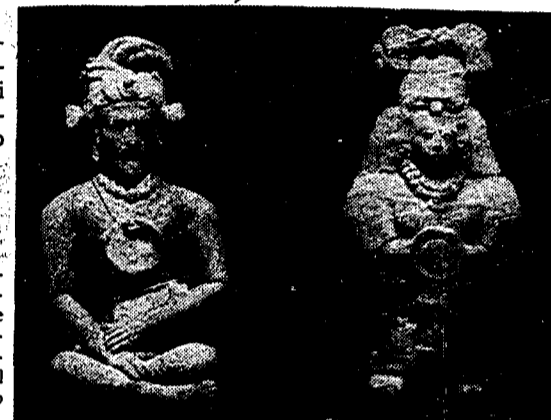
Cultura maya. Statuette ritrovate nelle tombe di Jaina (Campeche)

Attrazione internazionale il villaggio del film di Salvatores. Nei dipinti di Rivera e Siquieros esplose l'anima popolare. Pensano per immagini e colori i figli della terra del mais. Lo scrittore Albert Camus contro l'arroganza dei vincitori. Straordinario itinerario archeologico del Messico profondo.