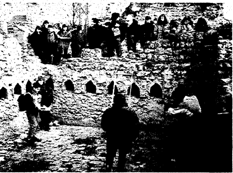
Uno dei programmi per i più piccoli di Junior Tv