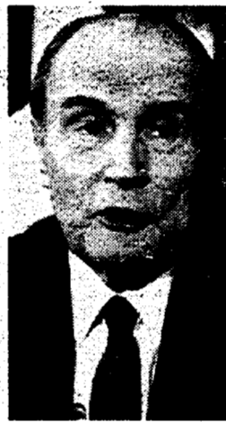
Qui accanto un manifesto elettorale francese. Sopra Mitterrand. In alto Chirac