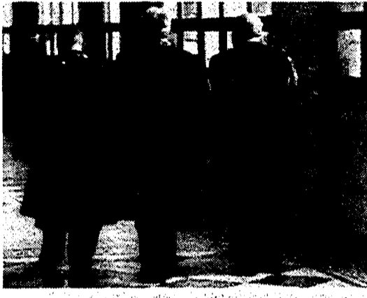
Locali della Corte di cassazione

Salvi e Barbera sono d'accordo: «una sortita personale di Segni il proposito di intervenire sulla Cassazione perché resti in campo il referendum sui Comuni...»