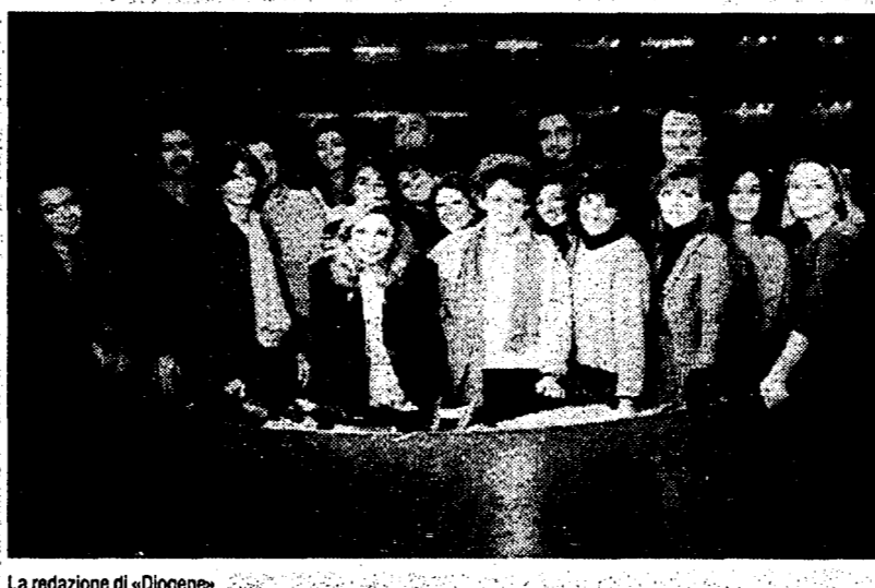
La redazione di «Diogene»