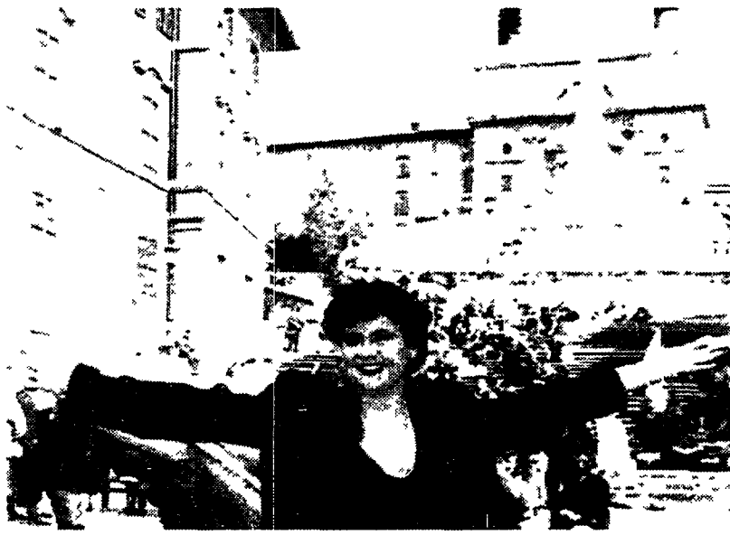
Marisa Laurito protagonista ad Antenna Cinema