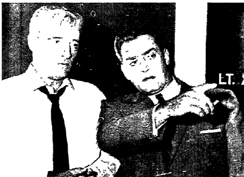
Paul Drake e Perry Mason in un telefilm d'epoca

Presentato ieri a viale Mazzini il programma di «Umbrafiction», che si terrà tra Perugia, Gubbio e Terni dal 21 aprile al 2 maggio. Molti i personaggi della cultura e dello spettacolo alla manifestazione serale dedicate a Sordi, Gassman, Raimond Burr e Adorf. Ma saranno i convegni e i Forum i fiori all'occhiello della kermesse. Si discuterà anche di un progetto europeo di tv e di new media