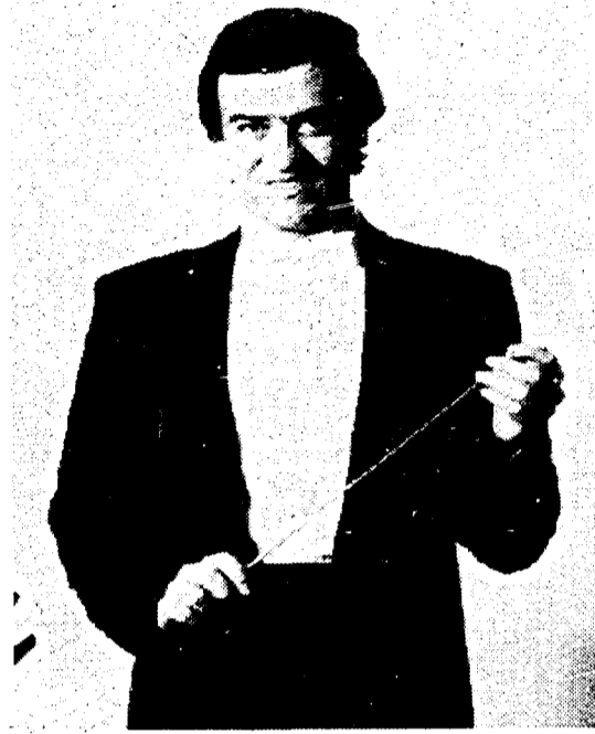
Il direttore Valerij Gergeev

In Europa il Principe Igor suscitò entusiasmi dopo la realizzazione in balletto delle famose danze ad opera di Diaghilev, nel 1909. La «prima» in Italia si ebbe alla Scala nel 1915. La «prima» al Teatro dell'Opera, quarant'anni dopo, diretta da Gianandrea Gavazzeni nel 1955. Stasera, alle 20, comunque, Borodin ci aspetta alla Conciliazione per festeggiare, con il Principe Igor , il suo centosessantunesimo compleanno (1833-1887).