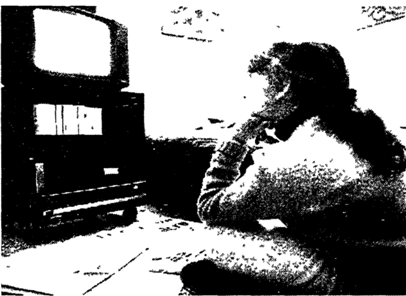
Bambini e televisione: un rapporto che fa discutere

Ma non è per questo che l'albero è in pericolo. Si sa che i bambini tra i 3 e i 4 anni non sono tantissimi e sono comun- que un pubblico così speciale che va curato e protetto. An- che chi non crede ai ricami e alle campane di vetro non può non sapere che almeno i più piccoli vanno considerati un po' più preziosi dei punti share degli ascolti. E se non si fa un po' più di attenzione si rischia di fare loro il vuoto al- torno. Cosa che almeno per