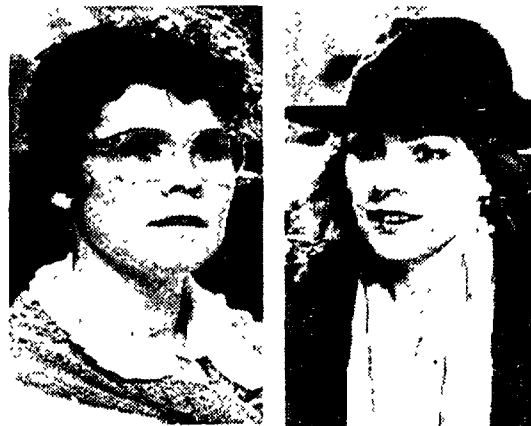
In alto, Imelda Staunton e Saskia Reeves in «Antonia e Jane». A destra, Wesley Snipes nel film «Passenger 57»

Girato spiritosamente, mischiando epoche e abbigliamento, il film ricostruisce il rapporto tra le due donne con l'aria di voler dire cose ben più universali sull'amicizia femminile. Esposta certo a invidie, rimpianti e dolori, ma più dura dell'acciaio, come attesta l'abbraccio cordiale che sigla l'ennesima cena-rimproverbia annuale. Beeban Kidron è molto brava nel mettere in commedia le nevrosi e i tic delle sue due protagoniste, in un gioco a incastro che deve parecchio alla leggerezza di Woody Allen. Tra i due ebrei che simpatizzano per il partito nazista, gatti che si chiamano «Jo, Es e Super Jo» e incubi in forma di film francesi sulla resistenza, Antonia e Jane bordeggia l'assurdo senza mai distaccarsi dall'alchimia terrena dei sentimenti. Grazie anche alla squisita prova delle due interpreti Saskia Reeves (Antonia) e Imelda Staunton (Jane), perfettamente intonate, nel contrasto fisico e psicologico, al clima agrodolce della storiella.