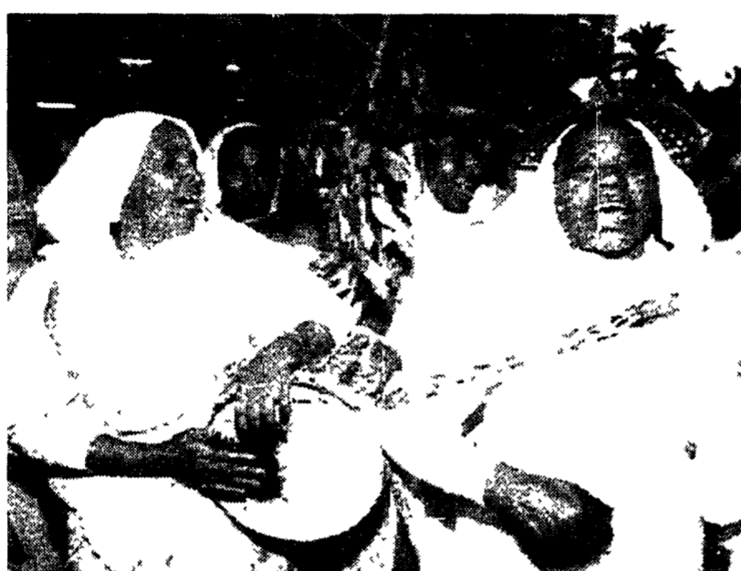
Donne eritree fanno festa per le strade di Asmara

L'Eritrea è indipendente. Il 99,8% dei votanti ha detto sì alla separazione dall'Etiopia nel referendum svoltosi sotto il controllo Onu. I tre giorni della nascita del nuovo Stato li racconta qui una scrittrice che sui cent'anni trascorsi dalla sua famiglia laggiù, e poi sulla storia d'amore tra un italiano e un'eritrea, ha scritto due romanzi. Asmara addio (Studio testi) e L'Abbandono (Einaudi)