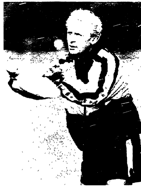
Giovanni Trapattoni, 54 anni, tecnico della Juventus