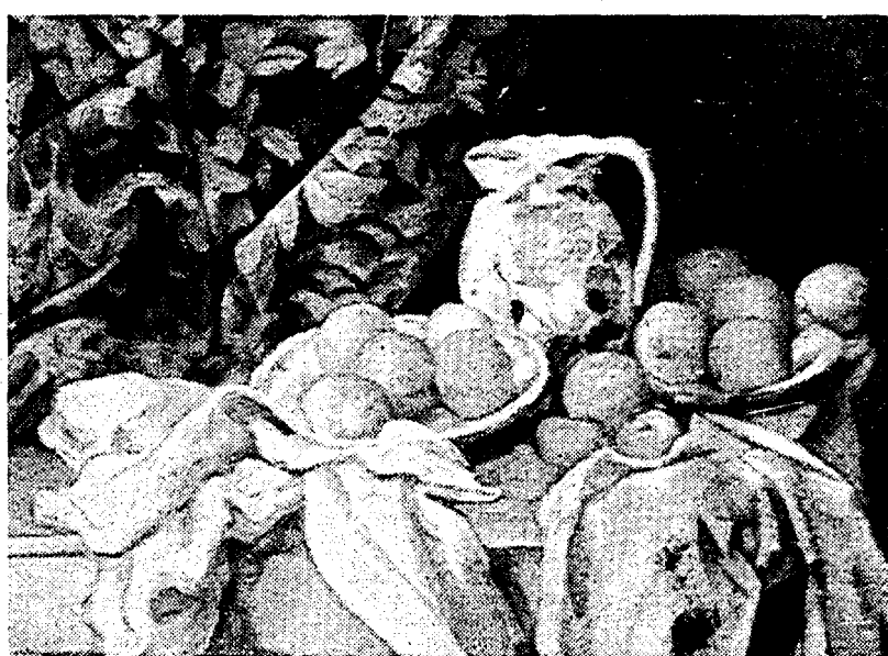
Paul Cézanne: «Natura morta con drappaggio»

Nottata speciale a Fuori orario. Dedicata ai cinefili e soprattutto ai cultori, gli studiosi, i fanatici di pittura. Otto ore di trasmissione (Raitre, dall'una di stanotte fino alle 9 di domattina) sul rapporto cinema/pittura, immagine in movimento/immagine ferma. Con un film di Godard (Passion) e due inediti assoluti per l'Italia, Akop Ovnatanjan dell'armeno-georgiano Paradzanov e Cézanne di Straub-Huillet.