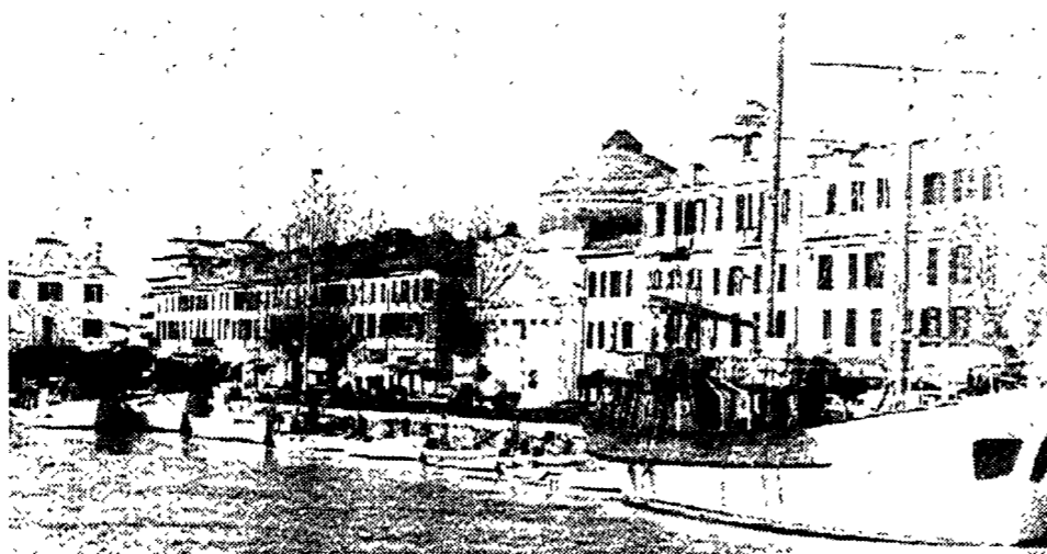
Una veduta del comune di Fiumicino