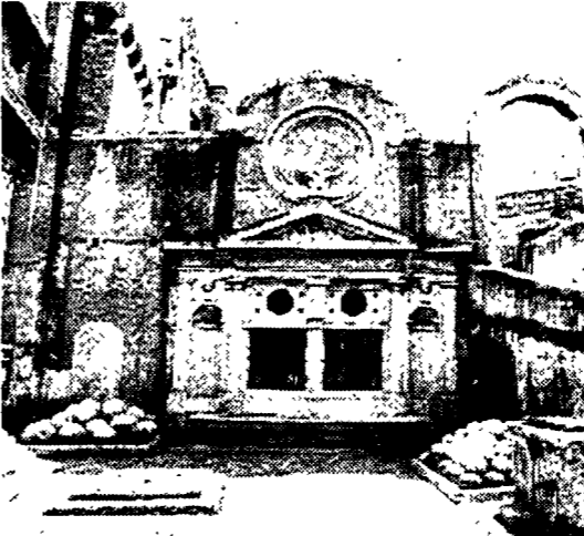
L'interno di Castel Sant'Angelo

Il punto vendita di materiale informativo è piuttosto sfortunato: le guide del museo (8.000 lire), in quattro lingue, qualche cartolina, pochi poster e libri sul castello. Al bar si trovano cartoline e varie guide in più lingue su Roma. Ci sono telefoni pubblici sia al piano terra che nei pressi del bar, in entrambi i casi non sono segnalati. Purtroppo manca il guardaroba, utile in una struttura così ampia. Accessibilità per i disabili: buona, toilette attrezzate ancora prima della biglietteria, ascensore disponibile per raggiungere tutti i piani, salvo la terrazza, a cui si accede attraverso una scaletta di dimensioni ridotte. Nel complesso comunque è visitabile più dell'80% del museo, e con tutte le scale che ci sono è un buon risultato. Visite guidate e tariffe: un cartello, in italiano, all'ingresso annuncia la possibilità di seguire due visite lunghe due percorsi orientati. La visita del percorso arancio parte tutti i giorni, dal martedì al sabato, dalle ore 10, per concludersi alle 11. Quella del percorso blu ha inizio, sempre