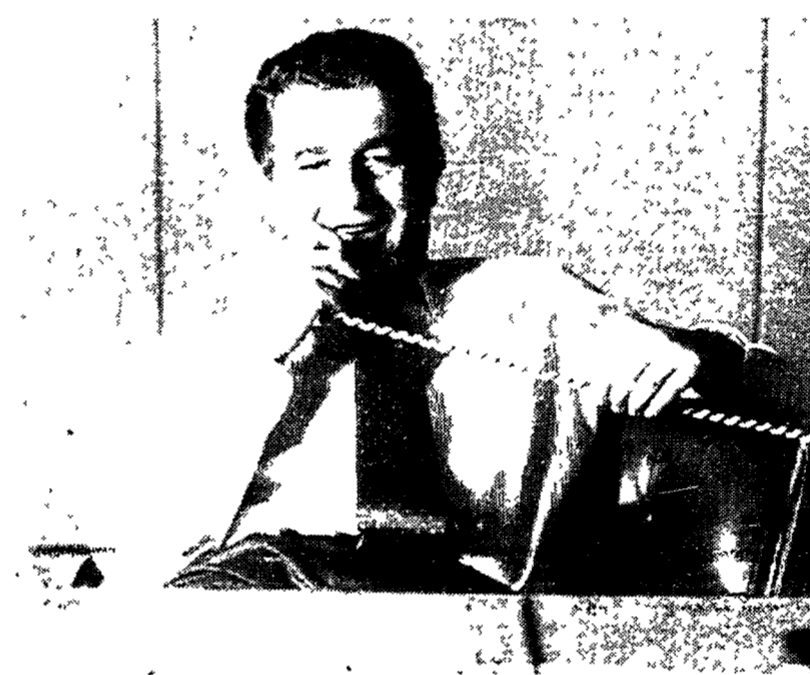
L'ingegner Carlo De Benedetti ha ammesso di aver pagato tangenti