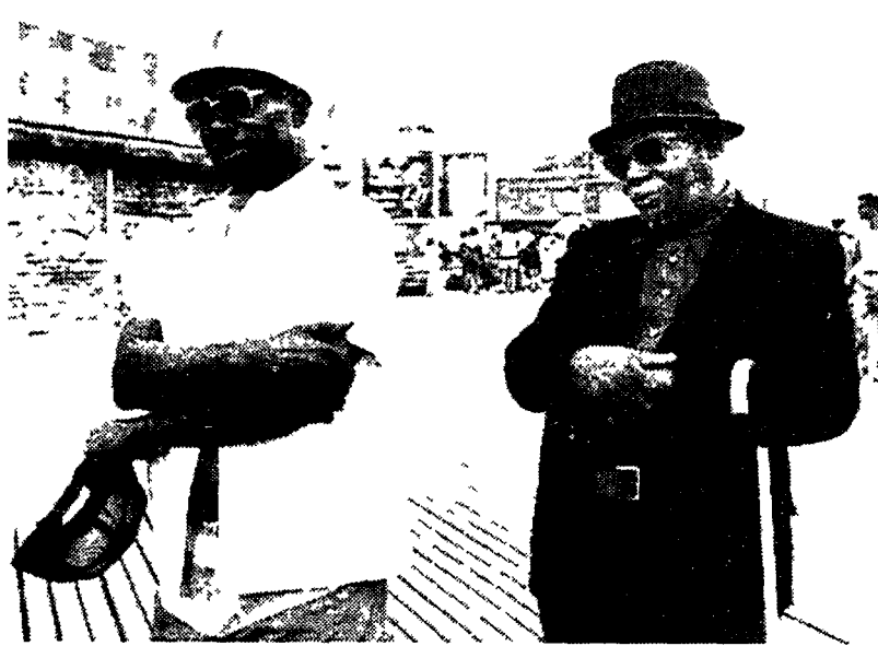
New York. Aspetti di vita quotidiana nel quartiere di Harlem

torna quel pessimista di Consolo) innocente perché non si rischia più l'errore e l'omissione come si rischiava nel passato, dall'antichità e fino a ieri. Ma anche innocente: viaddio almeno se parti da Roma con ancora negli occhi le immagini del Tg1 e appena arrivi in albergo a New York c'è un corredo all'indietro nel tempo (voiu verificare se ha detto il vero l'agenzia che ti ha venduto il tour (inclusivo di tv-satellite in stanza con bagno) e ti piazzati in poltrona a rivedere la faccia tesa di Andreotti nello stesso luogo). Altra cosa è dunque viaggiare davvero. È appunto bisogno di conoscere e di conoscersi, cioè strumento di verifica, occasione - ricercata - di confronto di costumi di culture e di idee. E allora per tornare a bomba ecco quel che mi sembra proporre l'Unità Vacanze al lettore di questo giornale: sono in grado non solo e non tanto di venderti un buon viaggio (il che sarebbe già un affare, considerati i prezzi che l'agenzia non avendo scopo di lucro è in grado di praticare) quanto anche e soprattutto