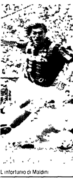
L'infarto di Maldini