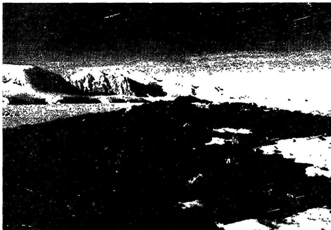
L'Antartide: il luogo della Terra con la maggior perdita di ozono stratosferico