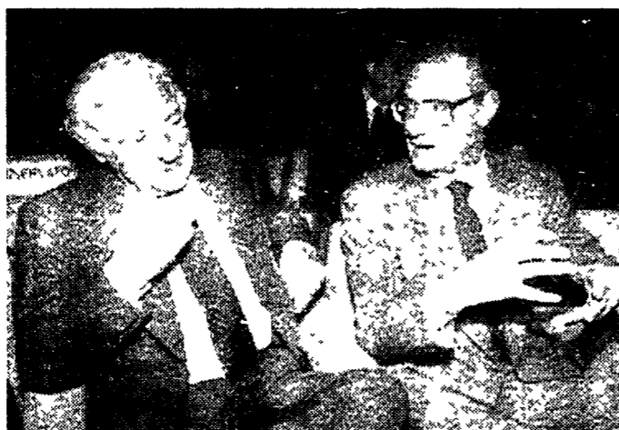
Cesare Romiti con Gianni Agnelli, presidente del gruppo Fiat

Nel mirino dei giudici i conti svizzeri per pagare tangenti