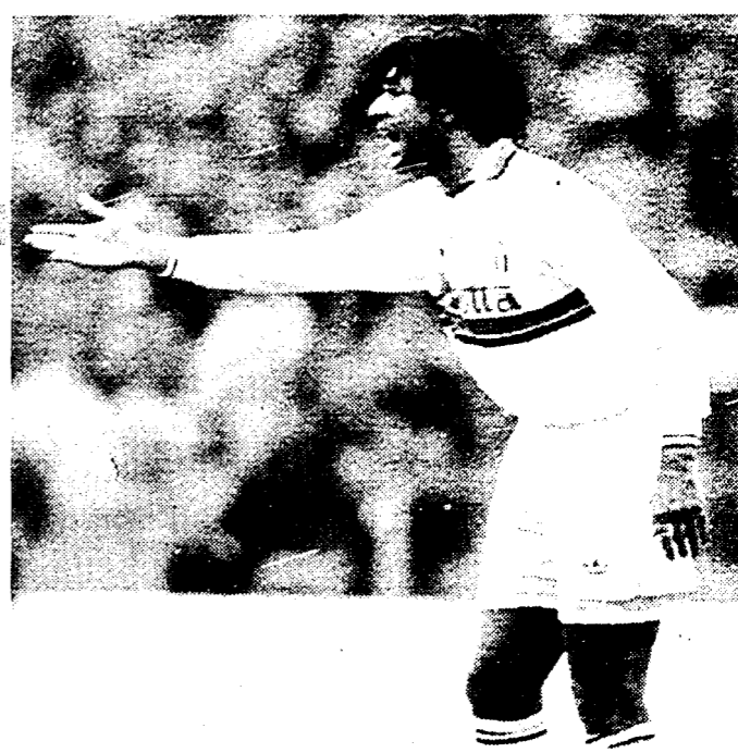
Dopo la disfatta in Coppa il Milan perde i pezzi. Dopo Rijkgaard, un altro olandese ha annunciato il suo addio: è Ruud Gullit. Al centro Rudi Voeller bacia la Coppa. Sotto la gioia dei tifosi dell'Olympique per le strade di Marsiglia