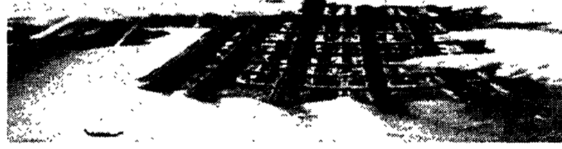
Qui a fianco: Mount Fuji, la città a forma di vulcano progettata dagli architetti giapponesi...