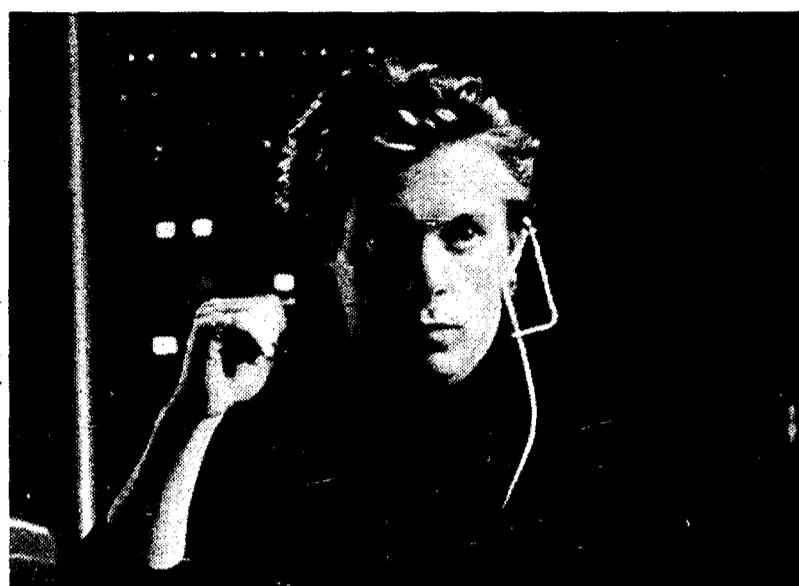
Gary Cole, protagonista di «Voci nella notte», da stasera su Italia 1

Stasera su Italia 1 alle 23.30 torna Jack Killiam, protagonista della nuova serie di Voci nella notte, il telefilm americano sugli incontri on the air di un disc-jockey al microfono di una radio di San Francisco. Ogni telefonata è una storia a sé: alcolisti soli, cuori infranti, mogli infelici, prostitute sfruttate. Ed ora anche in Italia, le confessioni notturne per radio stanno diventando un «fenomeno» rilevante.