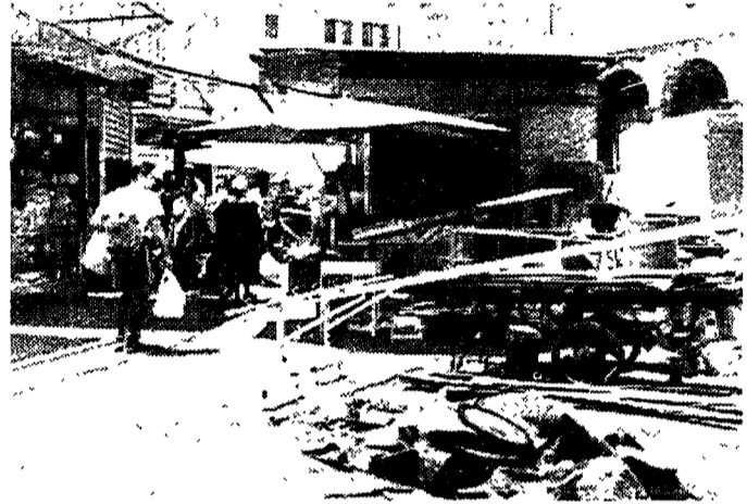
Il mercato di piazza Vittorio