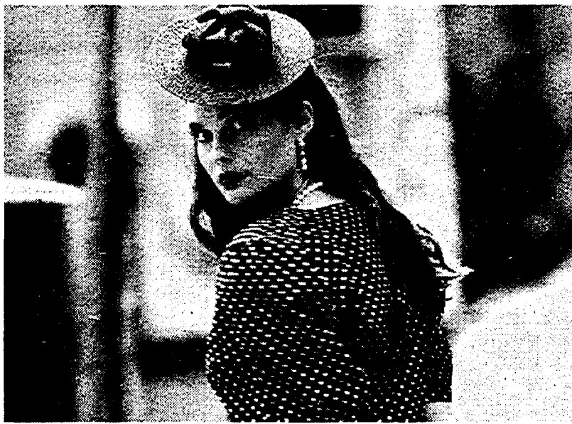
Carol Alt, l'attrice protagonista di «Missione d'amore» di Dino Risi

Dice il regista con il suo modo pacatamente ironico: «È un mistero che non mi si spiegarono le cose perché doveva essere pronto per la messa in onda, poi hanno deciso che era meglio rimandare tutto a giugno e ora di nuovo parlano di farlo vedere in settembre. Sono tre puntate e sembra che trovare tre giorni per la programmazione sia un'impresa titanica. La settimana non è di 7 giorni, ma di 3. Il mercoledì c'è lo sport, il giovedì Mike e insomma lo spazio non si trova. Del resto non è solo il mio film a restare sospeso, ce ne sono altri 3 o 4, tra cui uno di Ponzi. Missione d'amore non è un tipico film-tv, non è girato in una stanza, è riuscito molto spettacolare e Carol Alt è stata molto brava. Si tratta di una storia popolare, quella di una ragazza bella e ricca che alla vigilia del matrimonio decide di farsi suora. A farla cambiare è stata l'esperienza di un viaggio in India, in quella povertà senza fine. Ha conosciuto un missionario italiano che poi ritroverà in Brasile, dove viene a contatto col peggio, con lo sfruttamento più selvaggio e con la violenza più brutale. Viene anche violentata e abortita. A meno che non sia proprio qui il motivo per cui non va in onda...»