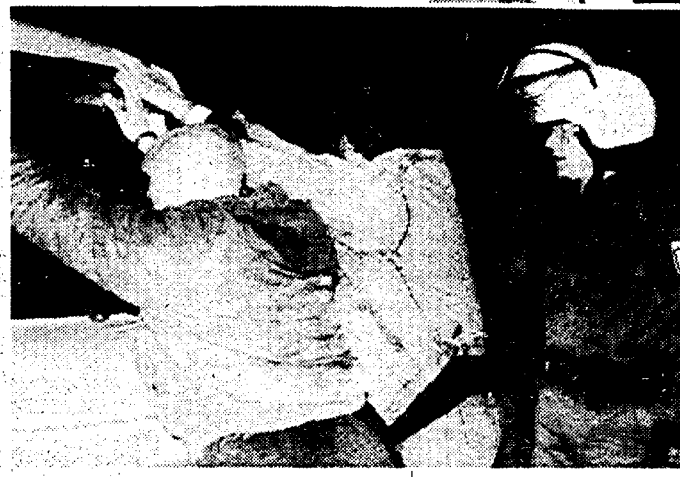
Un giovane naziskin e, a sinistra, la polizia fronteggia una manifestazione xenofoba

Otto Federico Guglielmo von der Wenge conte di Lambsdorff discende da un'antica famiglia della nobiltà baltica, ma non è proprio per le sue ascendenze che è famoso in Germania quanto per i suoi trascorsi più immediati.