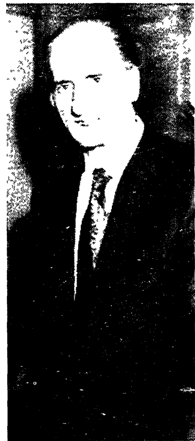
Il ministro della Giustizia Giovanni Conso e, a destra il pm Antonio Di Pietro

COMO Alle undici circa dalle telecamere, è arrivato Di Pietro. Il ministro Conso aveva appena iniziato il suo discorso all'ultima giornata del congresso dell'Associazione magistrati ma già si capiva che il copione previsto non sarebbe stato rispettato.