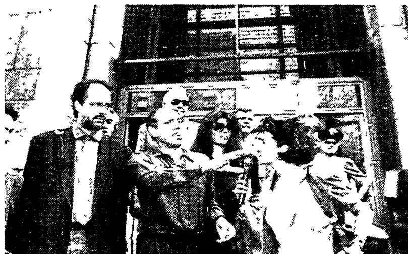
Adriano Celentano all'uscita da Palazzo di giustizia a Milano

Celentano dai giudici «La malasanità? Ve la racconto io»