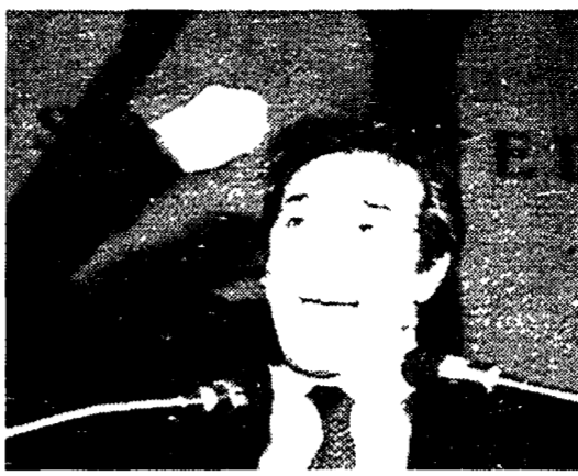
Il segretario generale della Cisl Sergio D'Antoni

Il 95 per cento dei voti al segretario generale che urla la sua innocenza e convince i delegati