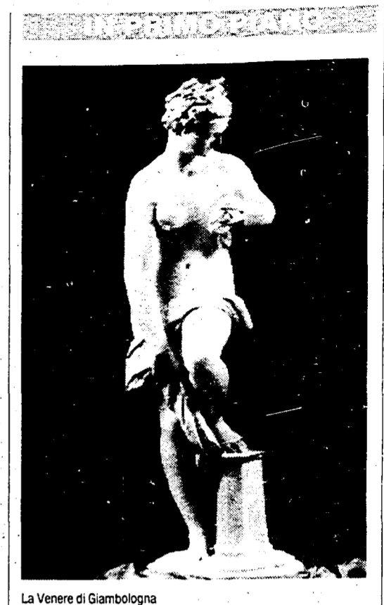
La Venere di Giambologna

batterlo 18 a 13 negli spareggi, il merito va all'allenatore Cucchiarelli, ex direttore tecnico della Nazionale, ma soprattutto ai giovanissimi che compongono la rosa dei giocatori.