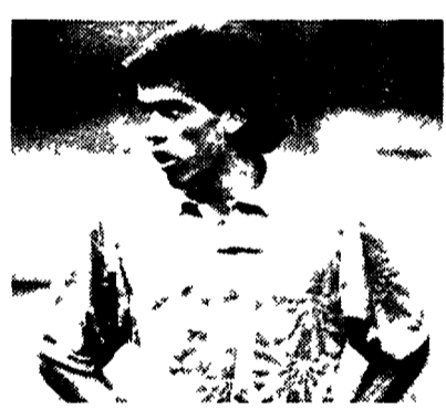
Daniel Fonseca 24 anni attaccante Il Milan lo cerca ma non vuol spendere troppo A sinistra Paulo Sousa

E sempre Fonseca a tener banco a Cernobbio. Il Napoli ha dato tempo al Milan fino a venerdì, dopodiché toglierà l'uruguaio dal mercato. Le offerte risponderà per ora vengono considerate inadeguate. Oggi potrebbe essere il giorno decisivo per Dell'Anno all'Inter. In attesa di Di Mauro e Ferrara la Lazio prende Ivano Bonetti. Il Cagliari ha scelto Paulo Sousa. Effenberg accetta la B