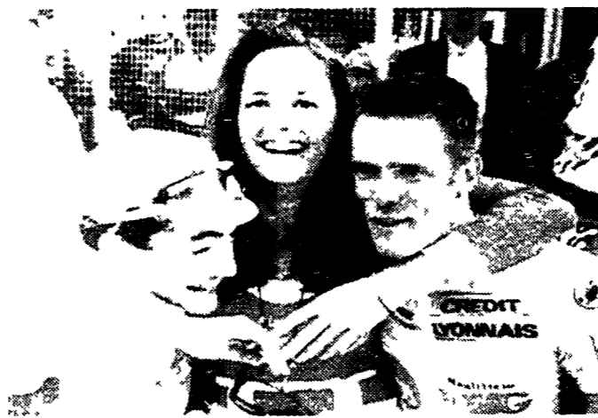
Un po' di relax per i rubacuori Chiappucci e Cipollini