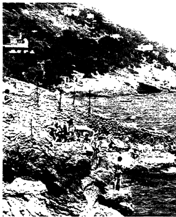
Bagnanti in cerca di sole e di un posto. In alto una splendida veduta del Circeo

SAN FELICE CIRCEO Malstrada alla conquista del paradiso di Circe maga. Pontina simulatastrada con le uscite bianco-azzurre «Mostacciano, Spinaceto, Fratica di mare, E Dinocità, senza più il cavallo di Troia per anni visibile nell'aria, poi l'ultima villa rettangolare rimasta a presidio della ex campagna, immersa come il sogno di un bambino nei grattacieli del quartiere estremo. Si parte per il Circeo con troppe suggestioni nel cuore per poterle tutte raccontare. Terra rossa e ultimi graffiti urbani («Ti amo Mozart/Bronx») prima dell'infinita bruttura periferica di Latina, poi «PLA...SMOO...ON» in mezzo all'intensiva industria, come intensiva ed assoluta dove essere sia bonifica fascista, compresa la foresta tutta da abballare e poi dissodare. E fra i residui agricolo-artigianali, nel traffico via via più micidiale senza accorgersene siamo già nel Parco. Grazie agli uccelli e soprattutto alle cicale che oltrepassando i decibel dei camion e delle macchine si sono fatti sentire. Dentro, è un assoluto di bellezza, natura calma dove farsi gradualmente penetrare da suoni e odori, fitte antecentrali di memoria, sospensione del tempo e del respiro. SABAUDIA , Sabaudia, fallica simbolo del regime appare in fondo al rettilineo solo con la sua stele. Poi aggazzata porge la piazza quadrata vero prato all'inglese contornato da pal-