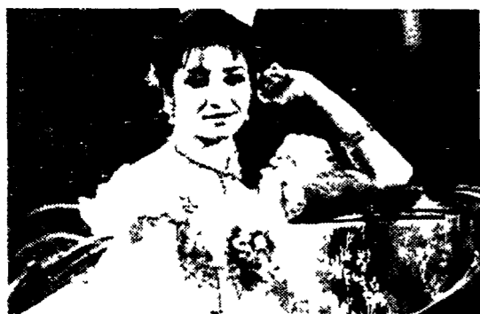
Un Palcoscenico per «La traviata» diretta da Riccardo Muti