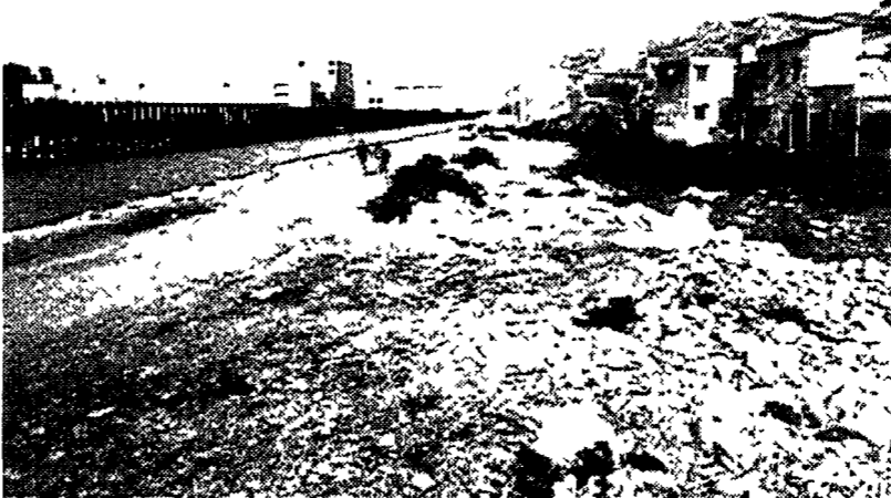
Un'immagine del quartiere Zen di Palermo città-set del progetto «Sensi unici»